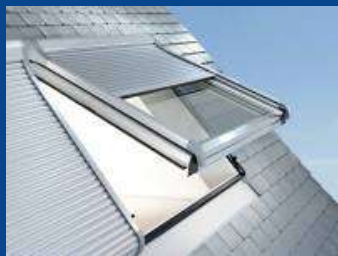
Fenêtres - Vitres - Façades